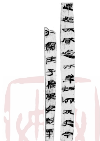
圖 3(簡 73EJT31 : 75, 簡 73EJT31 : 77, 自右向左排列)

和規格，與同一探方所見摘錄《論語》的 73EJT31 : 75 和 73EJT31 : 77 兩條簡文(參看圖 3)存在明顯差異。從殘存的簡文編號推斷(現存最大的編號是“百四”)，這一簡冊原來的規模一定很大。我們不大容易解釋，當時人爲什麼會以比抄寫《論語》還要嚴謹的態度和更高的規格，去抄寫一種篇幅很大的《孝經》傳注或解說，並將其遺留到了偏遠的肩水金關遺址裏面。