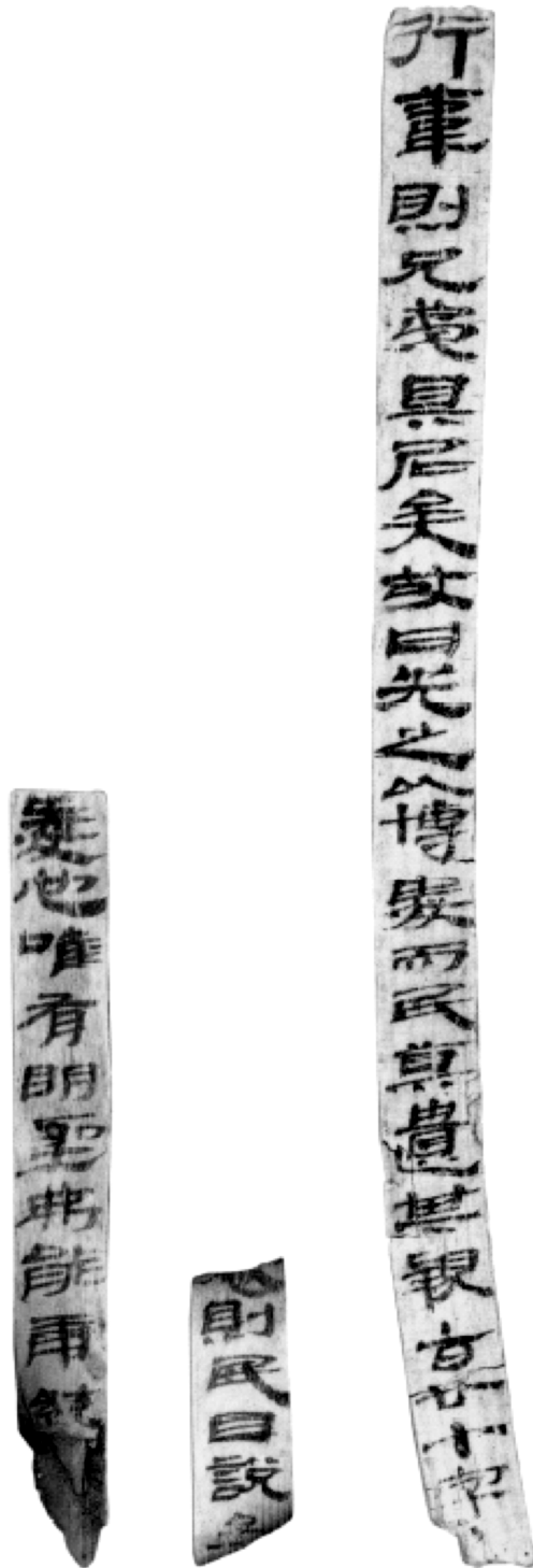
圖 2(簡 6 至簡 8, 自右向左排列)